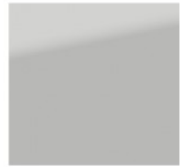
KOLOR LAKIERU: Precious Silver (1J6)